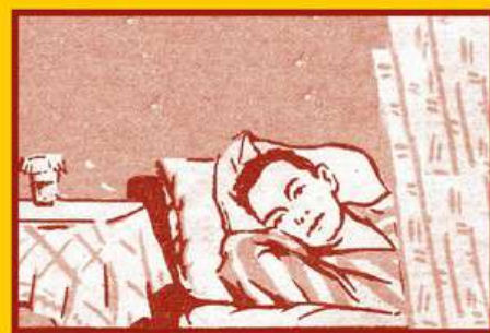
Избегайте контактов с заболевшими