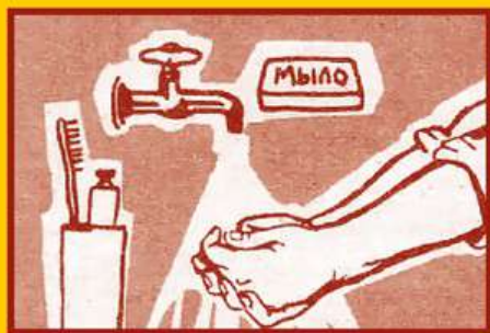
Регулярно мойте руки