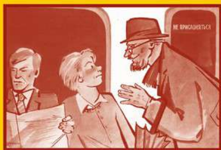
Ограничьте пребывание в местах скопления людей