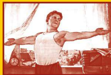
Ведите здоровый образ жизни